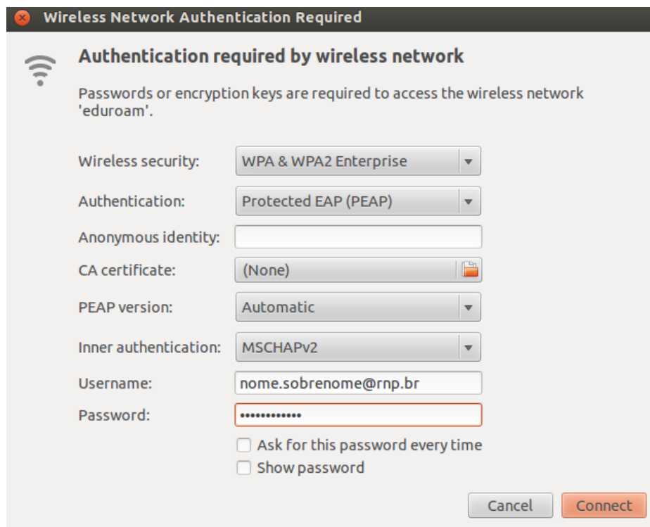
Figura 2 – Configurações para a rede eduroam.

Após clicar em Connect , uma janela aparecerá avisando-lhe que a conexão pode não ser segura devido à ausência de um certificado digital. Ignore o aviso. A conexão à rede eduroam deverá ser estabelecida com sucesso.