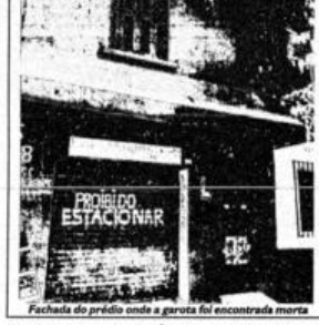
Fachada do prédio onde a garota foi encontrada morta