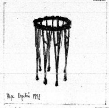
Rep. Epstein 1995

movimentos extremistas. Servem destros esquerda e fascistas da Argélia destroem escolas. "Eles não usam as mesmas estratégias, mas compartilham um objetivo comum: 'Viva a Morte', como grito de guerra", afirma Glucksmann em casa do filósofo espanhol Miguel de Unamuno. Eles matam políticos, cantores, jornalistas, escritores e líderes religiosos, mas não matam a terra à volta. Eles trocam armas, ideologias e até espalham suas palavras de ordem via Internet". Glucksmann diz ainda que a disputa (comunista judeu leva de Israel) norte-americana é uma das grandes patrocinadoras desse pensamento sectário. De fato, muito nos admira assistir na TV a uma ps de judeus israelenses comemorando com festa o assassinato do premiado israelense. Em que estes barbados queixo espalham os palestras de terrorismo israelense, por que se limitam a covilar o ódio a Israel? Por que não vão para lá enfrentar seus inimigos — não por ódio, deixo por deusa?