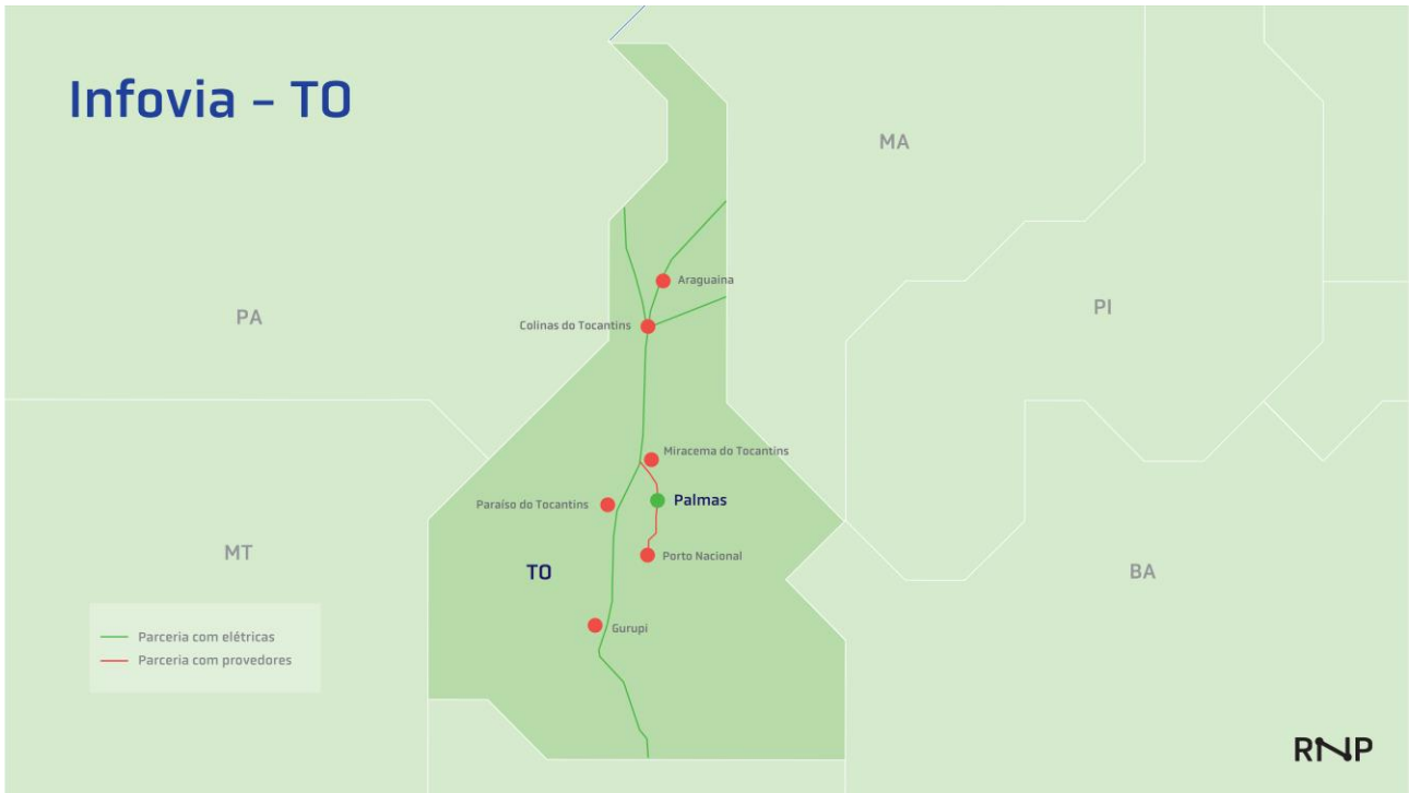
Figura 4. Infovia TO

As infraestruturas ópticas pretendidas pela RNP, para este Termo de Referência, estão detalhadas nas Tabelas 1, 2 e 3, a seguir. Cada tabela se refere a um tipo de infraestrutura óptica diferente, fibras ópticas em redes metropolitanas e longa distância e canais ópticos/capacidade em trechos de longa distância e/ou atendimentos dos pontos da RNP. Cada rede metropolitana e trecho de longa distância possui uma necessidade da RNP no que diz respeito à quantidade de fibras e/ou capacidades/canais ópticos.