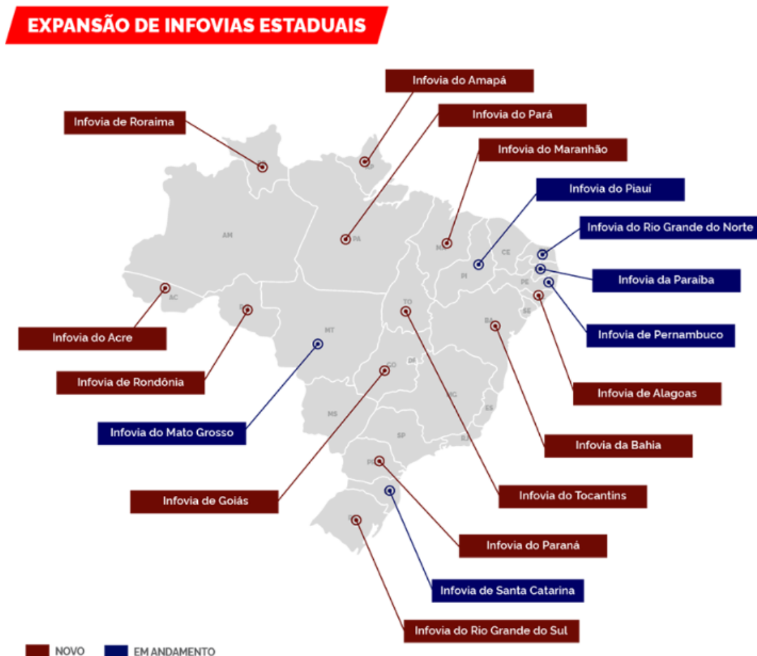
Figura 3: Infovias Estaduais

A Figura 3 apresenta as localidades onde a RNP implantará as Infovias nos estados.