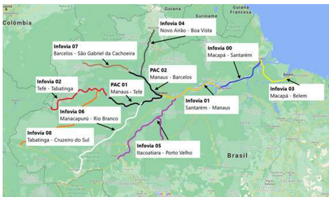
Figura 1- Infovias do Programa Norte Conectado

A implantação da primeira infovia - Infovia 00 Macapá – Santarém (Projeto Piloto), está sendo executada por meio de fomento à RNP através de seu contrato de gestão com o MCTI (à época do início do projeto ainda com a pasta de Comunicações integrada a este ministério), em um ambiente de experimentação de novos e/ou consolidação de métodos, processos e boas práticas existentes, em especial, relacionados à sua implantação e sua sustentabilidade pós-implantação, com potencial de aproveitamento nas demais infovias do programa.